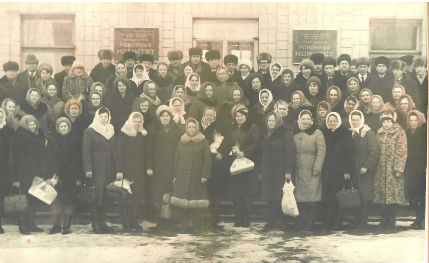
Районный слет передовиков производства. 1977 г.