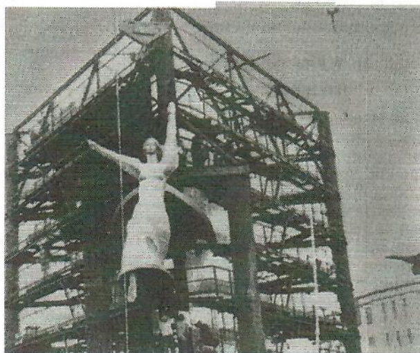
Монтаж фигуры потребовал огромных усилий.